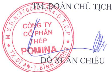
ĐỖ XUÂN CHIÊU